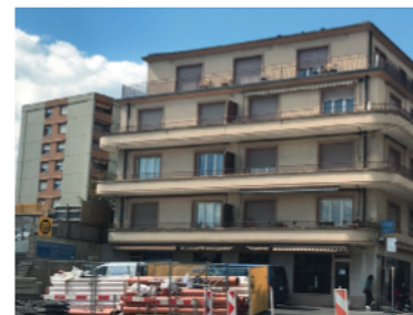
La papeterie Bauer et la Mise en Bière se situent au rez-de-chaussée de l'immeuble de la rue de Crissier 1

Pour plus d'infos, rendez-vous sur https://lamise.ch •