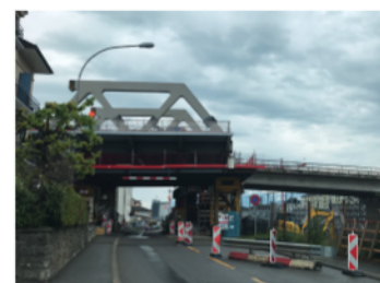
Installation d'un élément du nouveau pont

Attention, afin de procéder à la pose du nouvel ouvrage, le pont sera complètement fermé à la circulation dès le 12 juin à 20h jusqu'au 22 juillet à 05h. Une déviation sera mise en place par le passage inférieur du Léman qui ouvrira début juin dans les deux sens.