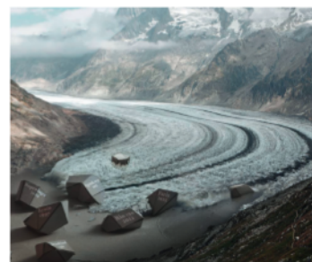
Illustration de l'objectif N° 13: Mesures de lutte contre les changements climatiques

Chacune des images originales du photographe Dario Lanfranco illustre l'un des 17 objectifs de développement durable adoptés par la communauté internationale. Cette exposition fait écho à l'engagement de la Ville de Renens en matière de durabilité depuis près de 20 ans.