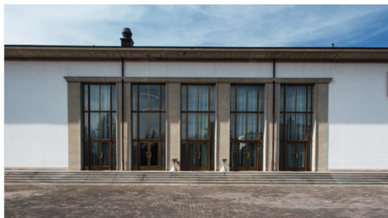
Salle de spectacles de Renens

Myriam Romano Malagrifa, Municipale Culture-Jeunesse- Affaires scolaires-Sport