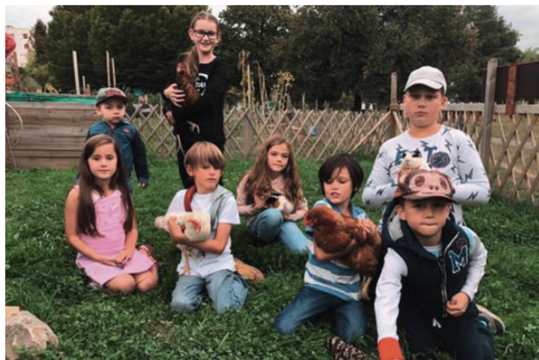
Les enfants du quartier d'En Belle-Vue et les animaux du Parc des Paudex

Les bénévoles se réjouissent de l'accueil très positif reçu de la part des habitants du quartier et des sourires des enfants qui viennent déjà en nombre observer les animaux. C'est avec plaisir qu'ils partageront avec vous cette riche expérience humaine et pédagogique. N'hésitez pas à leur rendre visite, rendez-vous au parc des Paudex!