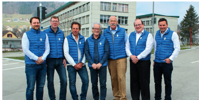
Les partenaires du projet i21

Plus d'information sur www.industrie21.ch •