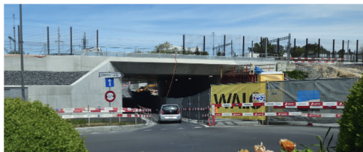
Le passage inférieur du Léman vu depuis le côté Sud

Ce projet mené par Léman 2030 et financé par la Confédération et la Ville de Renens permettra le transit dans un même espace de trois modes de mobilité (piétons, cycles et trafic routier). Par ailleurs, le trafic poids lourds pourra nouvellement circuler sans restriction de hauteur sur cet axe. Son prolongement permet l'intégration en surface de nouvelles voies (dont la 4 e voie construite entre Lausanne et Renens) et du saut-de-mouton pour les besoins des travaux Léman 2030. ●