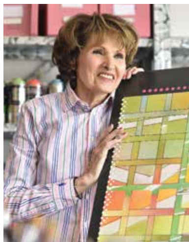
«C'est là que toujours le peintre se double d'un poète»